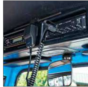
Impianto sonoro completo di microfono e altoparlante