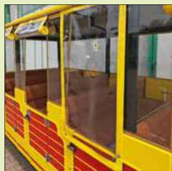
Combinazione chiusura PVC e vetro