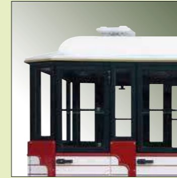
Oblò tetto carrozza