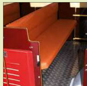
Sedili imbottiti di serie (varianti disponibili: nero, marrone, blue jeans)