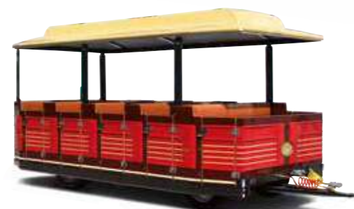
Equipaggiata di chiusura con portine apribili da un lato e fisse dall'altro.