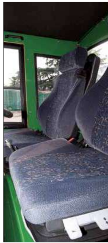
Sedile pneumatico mod. Grammer