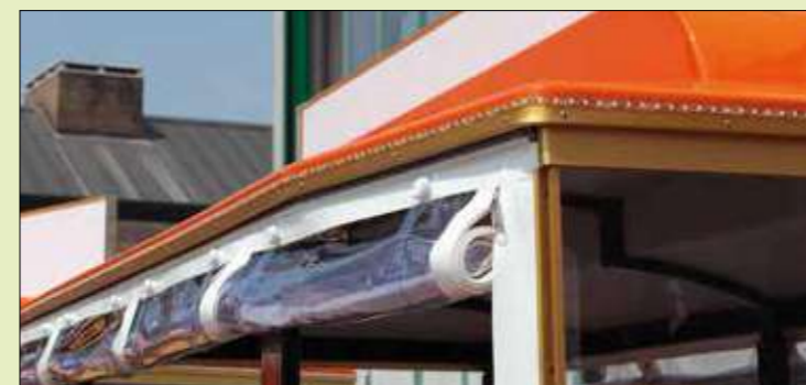
Sistema di Luci decorative a Led per bordo tetto