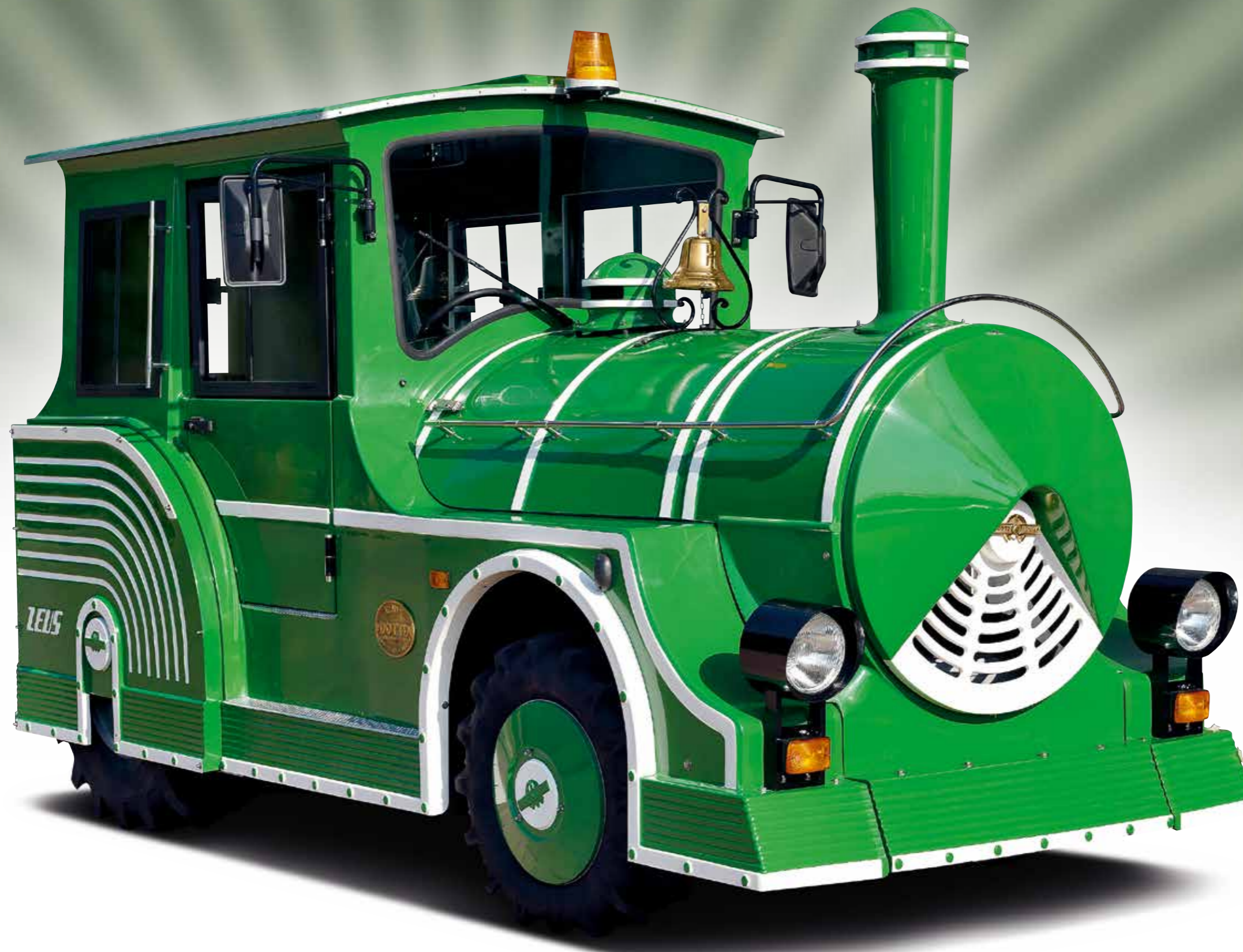
Porec - Croazia

Alcune caratteristiche potrebbero essere soggette a variazioni.