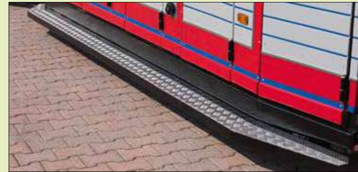
Pedana per salita