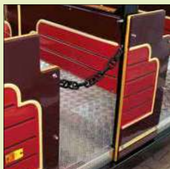
Chiusura con catene