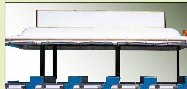
Pannello pubblicitario centrale per carrozza