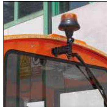
Sistema di Luci decorative a Led per bordo tetto locomotiva e Luce girevole a Led