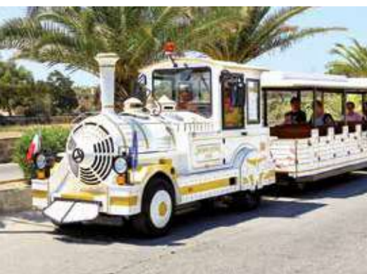
Parco Nazionale d'Abruzzo - Italia