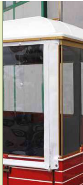
Combinazione chiusura PVC e vetro