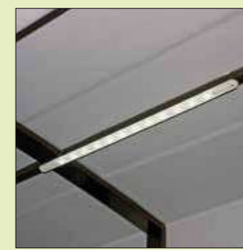
Luce interna a Led