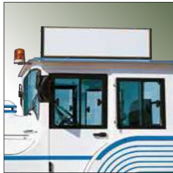
Pannello pubblicitario centrale per locomotiva