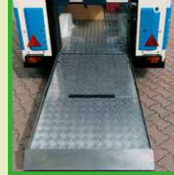
Pedana pneumatica per accesso persone diversamente abili