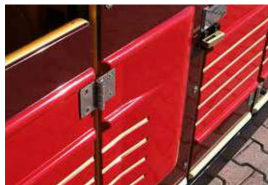
Particolare pannello porta.