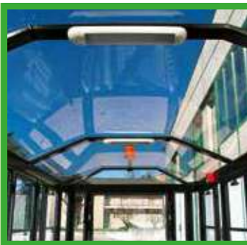
Tettoia trasparente in policarbonato