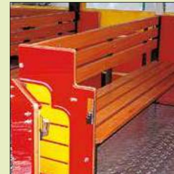
Sedili in legno