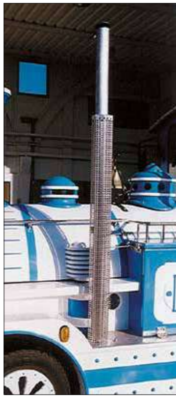
Scarico Inox esterno verso l'alto