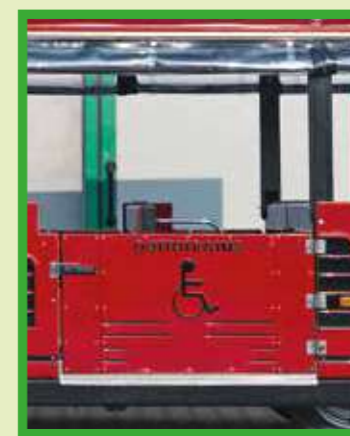
Dispositivo manuale laterale per diversamente abili e carrozzine