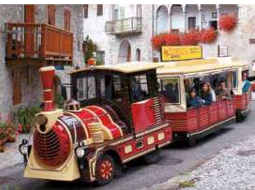
Castelfranco Veneto - Italia