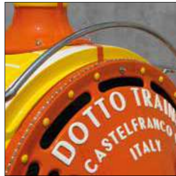
Sistema di Luci decorative a Led per frontale locomotiva