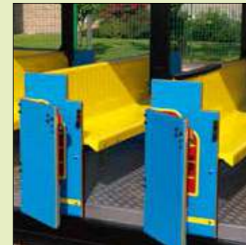
Sedili in vetroresina